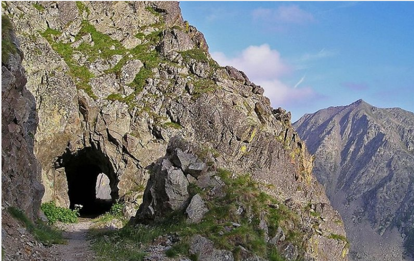
Chemin de l'Energie pour monter au refuge du Rabuons