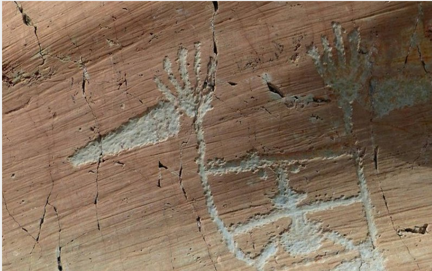
Gravure rupestre de la vallée des Merveilles, le Sorcier