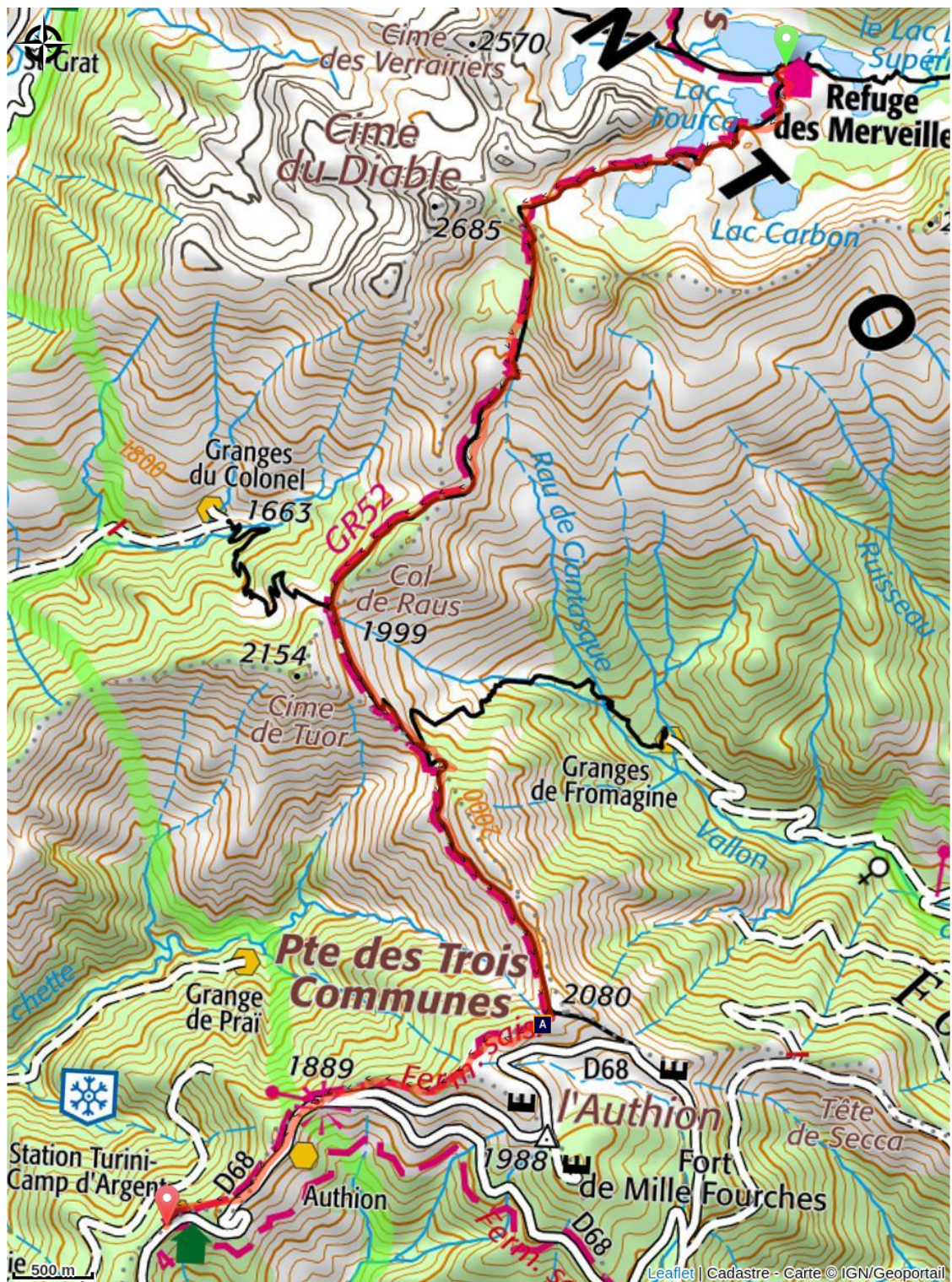
🕒 Fortino dei Tre Comuni (A)