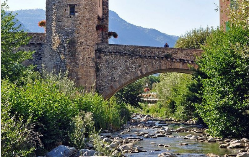
Le vieux pont médiéval du village Sospel.