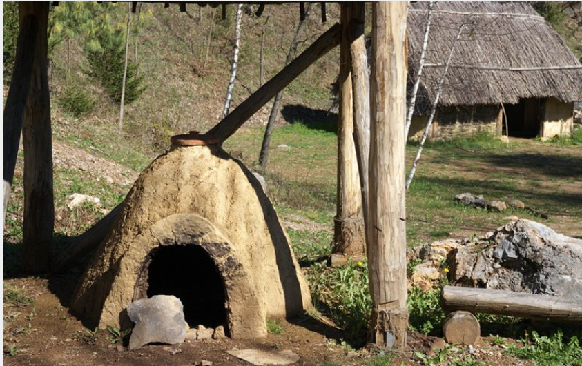
La fornace per la terracotta al Parco archeodidattico della Roccarina (Roberto Pockaj)