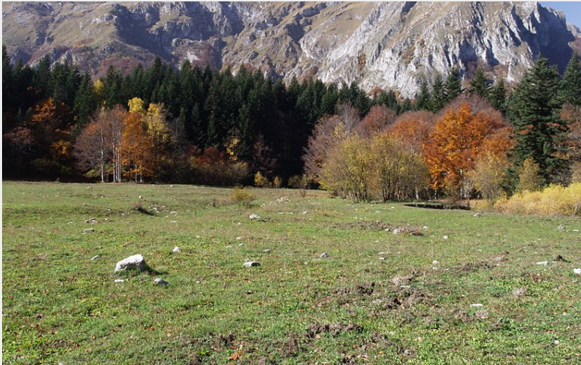
La radura di Pian del Creus; sullo sfondo, a destra, Punta Labaia Mirauda (Roberto Pockaj)