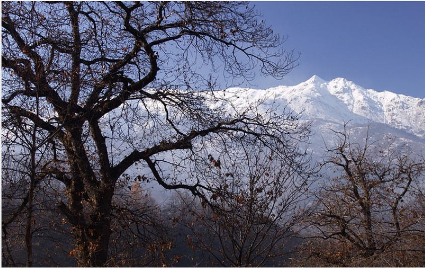
I castagneti che si incontrano arrivando a Tetti Fuggin