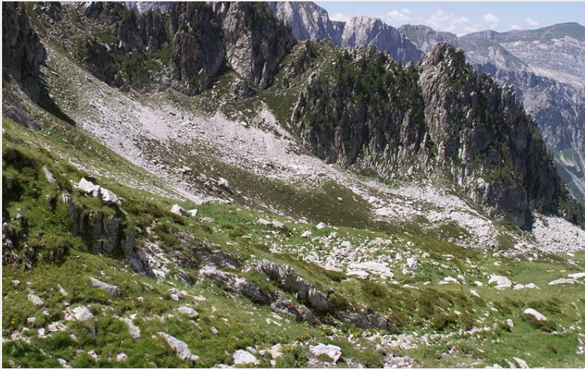
Il vallone che conduce a Porta Sestrera dal Rifugio Garelli (Roberto Pockaj)