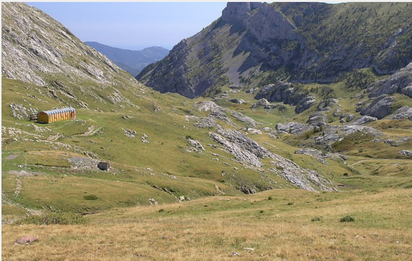
Il vecchio Rifugio Don Barbera e il Vallone dei Maestri dal Colle dei Signori (Roberto Pockaj)