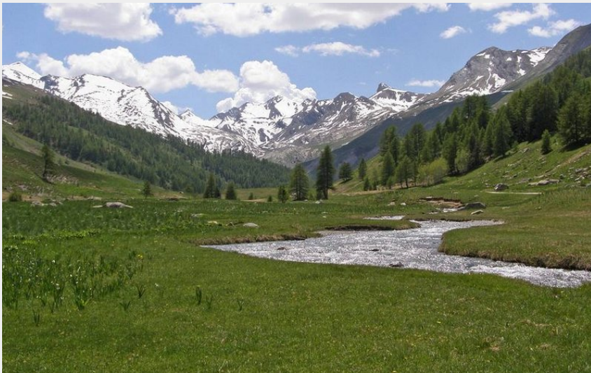
Randonnée Ubaye. L'Ubayette dans le vallon du Lauzanier A (Elise Minssieux - PNM)