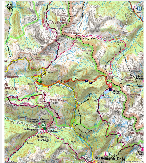
Randonnée Tinée. Maisons au Pra, hameau de haute-Tinée. Quelques névés en début de printemps.