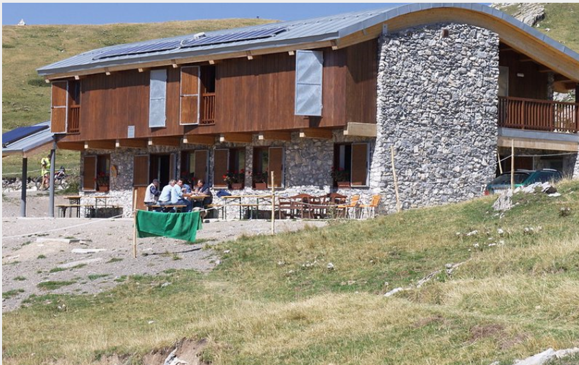
Il nuovo Rifugio Don Barbera (Roberto Pockaj)