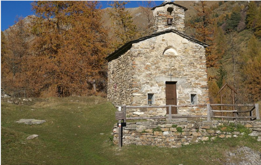
La Cappella della Madonna della Neve presso Upega (Roberto Pockaj)