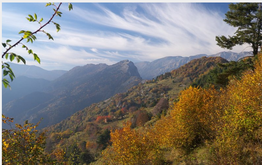
Panorama dai pressi della Madonna dei Cancelli (Roberto Pockaj)