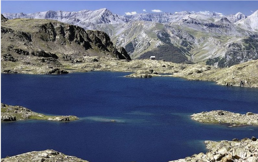
Randonnée Tinée. Lac de Rabuons, 2523 m.