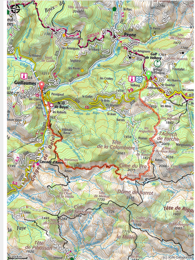
Randonnées Valberg. Cascade d'Amen dans la cluse du même nom. Blocs de pélites rouges entassés par les crues.