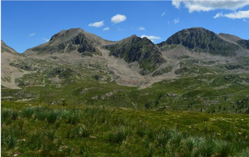
Colle Dei Morti et Passo Orgials (Fabrice Henon)