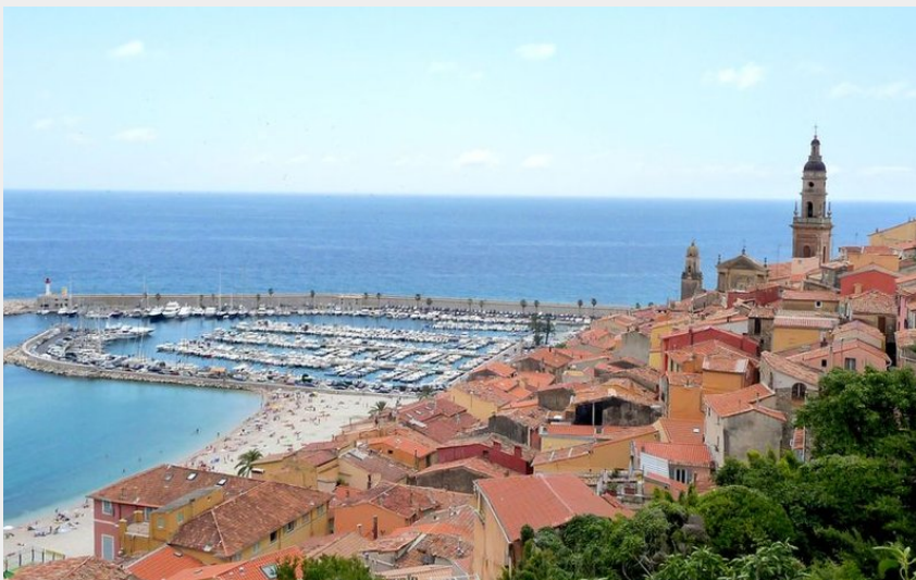
Randonnée au départ de Menton, vieille ville.