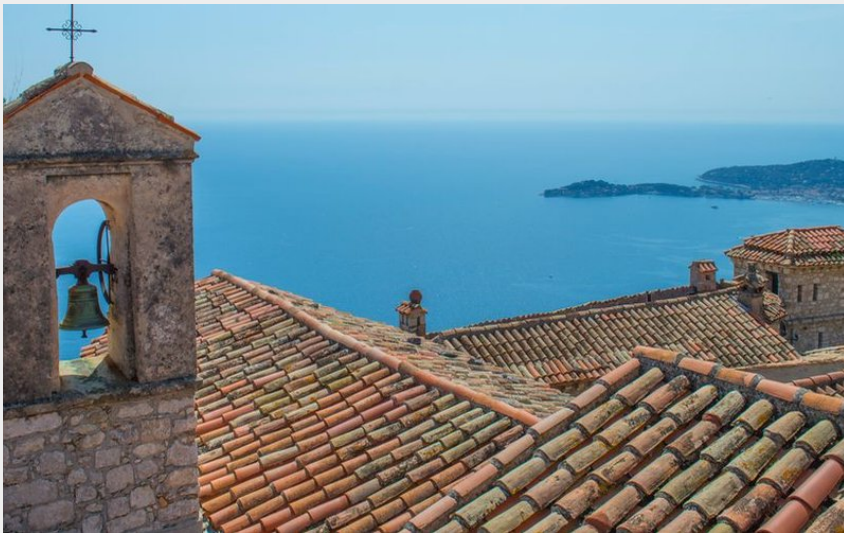
Randonnée à Eze.