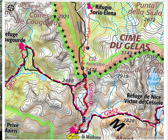
Randonnée col de Fenestre. Un ancien poste de chasse en pierres sèches du roi Victor Emmanuel II au dessus du Lac de Fenestre.