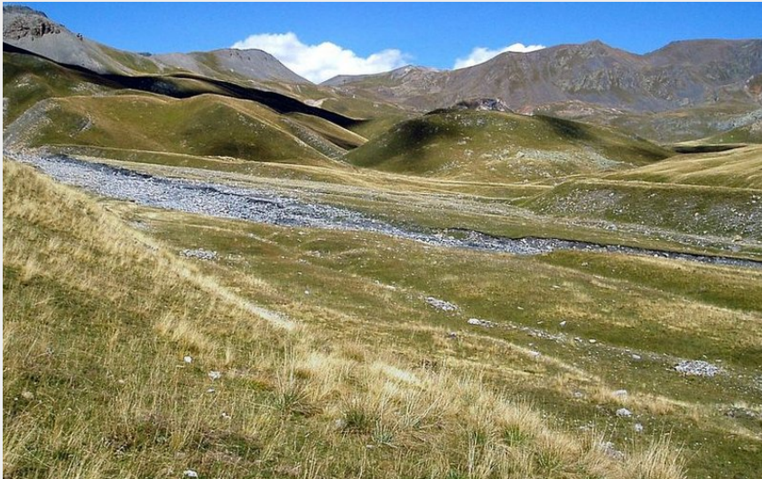
Le Salso Moréno, Pouriac.