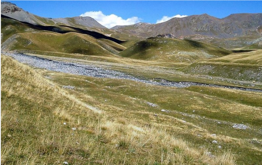
Le Salso Moréno, Pouriac.