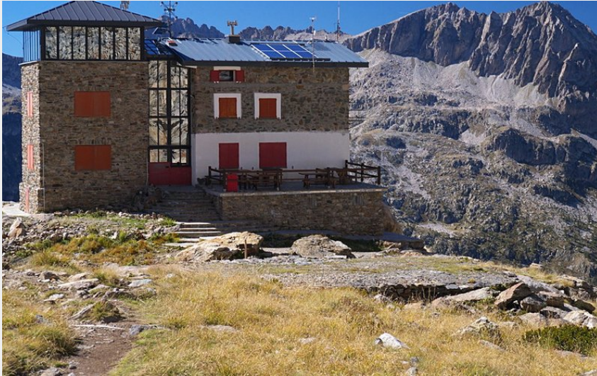
Il Rifugio Remondino (Roberto Pockaj)